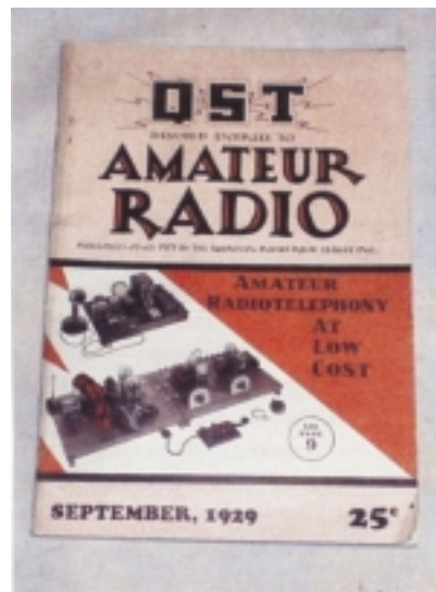
Obr. 1. Titulní strana časopisu QST, kde byla po prvé popsána anténa WINDOM

Anténa WINDOM je rezonanční, zpravidla horizontální zářič, napájený jednodrátovým napáječem (tzn. prostým vo-