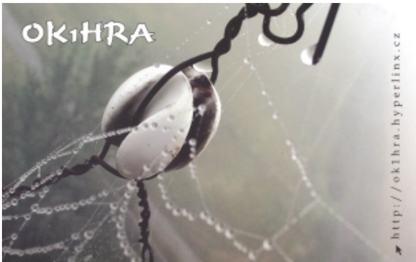
Obr. 1. Tento dekorační QSL-lístek, který jsme dostali za spojení s Danem, OK1HRA, ukazuje, že i tak technická záležitost, jakou je anténa, má v sobě kus poezie

Anténním izolátorem se rozumí vhodné těleso, které např. dělí dipólovou anténu v místě napájení na dvě části, popř. odděluje aktivní anténní vodič od upevňovací či závěsné konstrukce. Aktivní anténní vodič se zavěšuje mezi opěrné (zá-